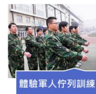
體驗軍人佇列訓練